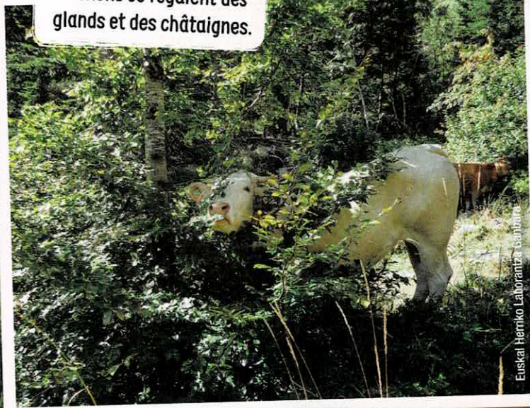
Euskal Herriko Laborantza Erakundeak

Dans les pâturages, les arbres peuvent servir de garde-manger. Les vaches broutent les feuilles et les cochons se régalaient des glands et des châtaignes.