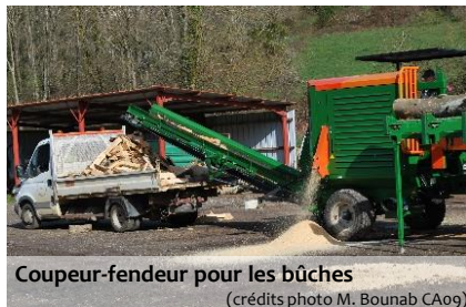
Coupeur-fendeur pour les bûches