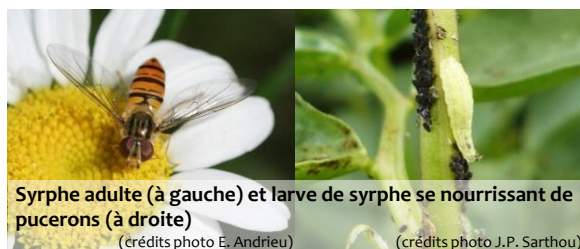
Syrphe adulte (à gauche) et larve de syrphe se nourrissant de pucerons (à droite)