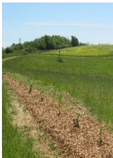
BRF sur une jeune haie

Le bois raméal fragmenté (BRF, broyat de jeunes branches et rameaux frais) peut servir en couverture du sol à la place de paillage plastique ou en amendement du sol. Les plaquettes de bois (broyat sec de branches et troncs) peuvent se substituer à la paille pour la litière des animaux d'élevage. Le biochar (poudre de charbon de bois) est de plus en plus utilisé pour amender les sols agricoles. La possibilité d'utiliser le feuillage de certaines essences comme fourrage est à nouveau envisagée comme une option crédible dans des systèmes sylvo-pastoraux. Enfin, les formations arborées sont aussi sources de produits non ligneux (gibier, fruits et champignons comestibles, plantes médicinales et aromatiques) commercialisables et de valeur non négligeable.