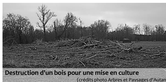
Destruction d'un bois pour une mise en culture

Offrant une grande diversité de produits et de services à de nombreux bénéficiaires, les arbres des paysages agricoles sont l'objet d'enjeux multiples. Ils restent pourtant globalement mal pris en compte dans des politiques sectorielles très segmentées et une politique territoriale de l'arbre agricole reste ainsi à construire. Les avancées de la recherche, la meilleure connaissance des systèmes traditionnels et les enjeux de la transition agroécologique contribuent à reconsidérer la place des arbres et de l'ensemble des services et produits qu'ils peuvent apporter.