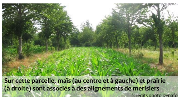
Sur cette parcelle, maïs (au centre et à gauche) et prairie (à droite) sont associés à des alignements de merisiers

L'agroforesterie, au sens d'une gestion conjointe des formations arborées au sein des exploitations et des territoires agricoles, est un maillon essentiel de la transition agroécologique qui s'amorce. Elle est généralement accompagnée d'autres pratiques agroécologiques avec lesquelles elle interagit : choix des cultures, de leur association et de leur succession (rotation), utilisation de couverts végétaux entre deux cultures (intercultures), simplification ou arrêt du travail du sol.