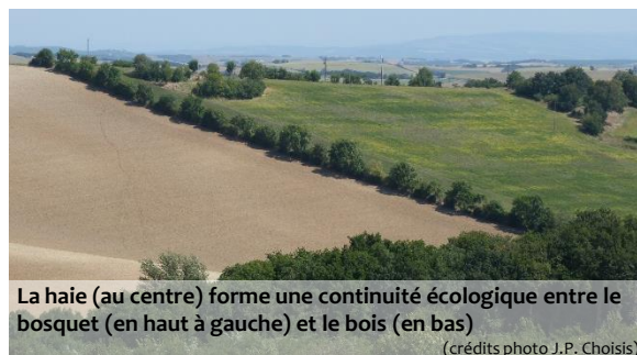
La haie (au centre) forme une continuité écologique entre le bosquet (en haut à gauche) et le bois (en bas)

Les formations arborées sont des composantes essentielles des paysages pour conserver la biodiversité. Elles assurent un rôle majeur de continuité écologique, sur laquelle la trame verte et bleue (TVB) se fonde pour construire les politiques nationales (Grenelle de l'environnement) et leurs déclinaisons régionales (schémas régionaux de cohérence écologique : SRCE) et locales (plans locaux d'urbanismes : PLU). Les formations arborées apportent aussi le caractère typique de nombreux paysages qui contribue souvent à leur attractivité récréative et touristique ou à leur image de marque. Cette typicité peut aussi participer au sentiment d'appartenance au lieu, facteur de bien-être social.