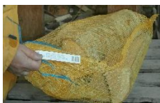
Filet de bûchettes