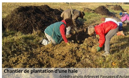
Chantier de plantation d'une haie