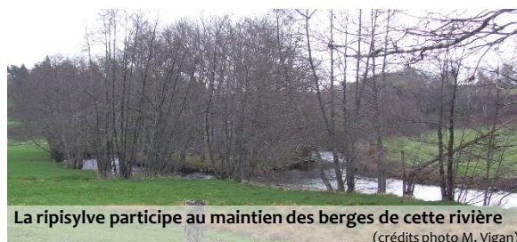
La ripisylve participe au maintien des berges de cette rivière

En plus des produits, ligneux et non ligneux, les formations arborées sont aussi à l'origine de services écosystémiques dont bénéficient les agriculteurs mais également d'autres composantes de la société. Dans ces nombreux services, on peut inclure le rôle régulateur des arbres sur le microclimat (température, vent, humidité) dont bénéficient les cultures et les animaux d'élevage. Ils jouent aussi des rôles clé dans le contrôle de l'érosion qui menace de nombreuses parcelles. Dans les paysages bocagers par exemple, les versants plantés de haies présentent globalement moins de pertes de sol vers les cours d'eau. Plus globalement, les arbres participent très activement aux grands cycles du carbone (fixation de dioxyde de carbone (CO 2 )), de l'azote, des nutriments puisés en profondeur et de l'eau. Ils ont aussi des rôles épurateur ou protecteur contre les pollutions de l'air et de l'eau.