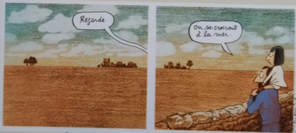
Dessin de Catherine Meurisse, qui fait écho au titre.

L'agroforesterie recouvre un vaste ensemble de pratiques agricoles (ou forestières !) à travers le monde, c'est même l'immense majorité des systèmes productifs que les humains ont façonné à travers les âges pour se nourrir, se chauffer, prélever des matériaux aux usages multiples, tout en tenant à bout de bras les écosystèmes naturels d'une richesse incroyable qui sous-tendent la fourniture durable de toutes ces ressources 2 .